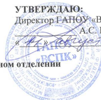
График сроков прохождения учебно-производственной практики на заочном отделении корпус по ул. Иркутская, д. 13 2023-2024 уч. год